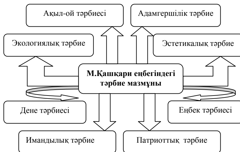
Сурет 1 – М.Қашқари еңбегіндегі тәрбие мазмұны

тұрғыдан сараптау арқылы М.Қашқари еңбегіндегі тәрбие мазмұнын бөліп көрсеттік (Сурет 1):