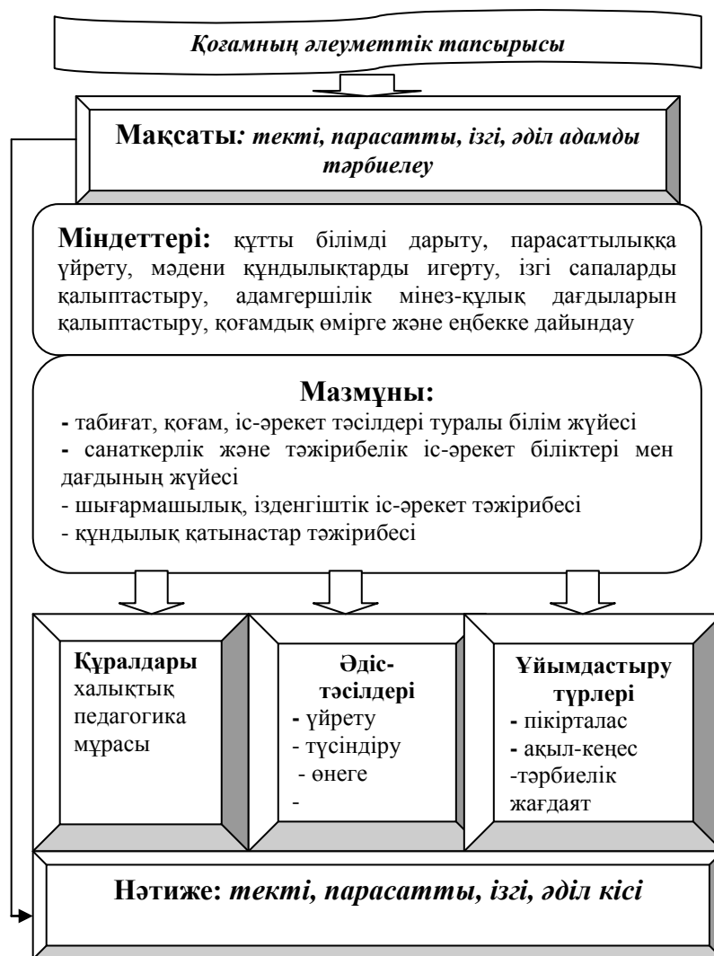
Сурет - 1 – «Құтты біліктегі» педагогикалық процесс құрылымы