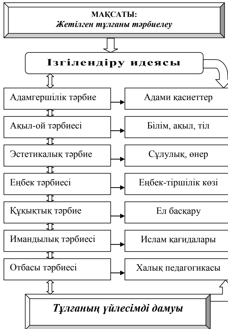
Сурет 4 - Ж.Баласағұнидің тәрбие теориясы