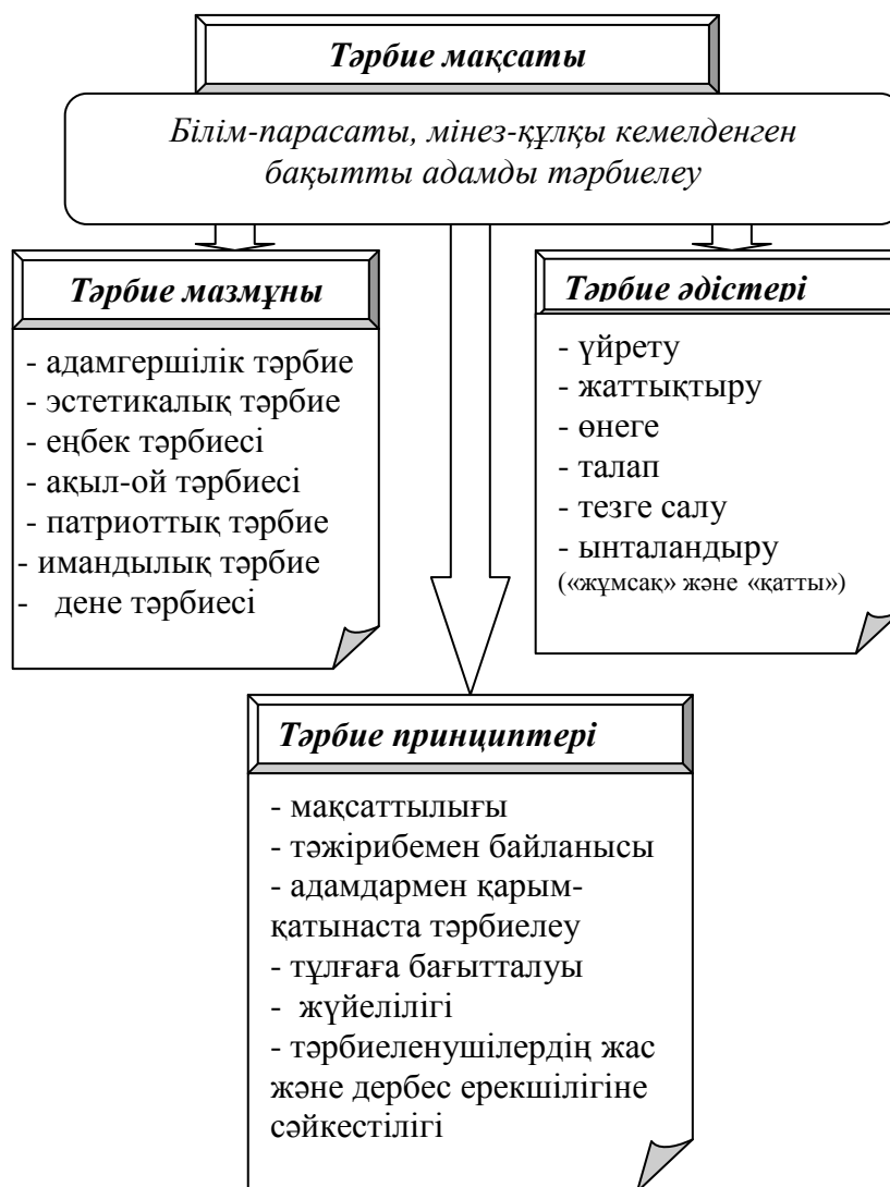
Сурет 2 - әл-Фараби тәрбие теориясының мәні